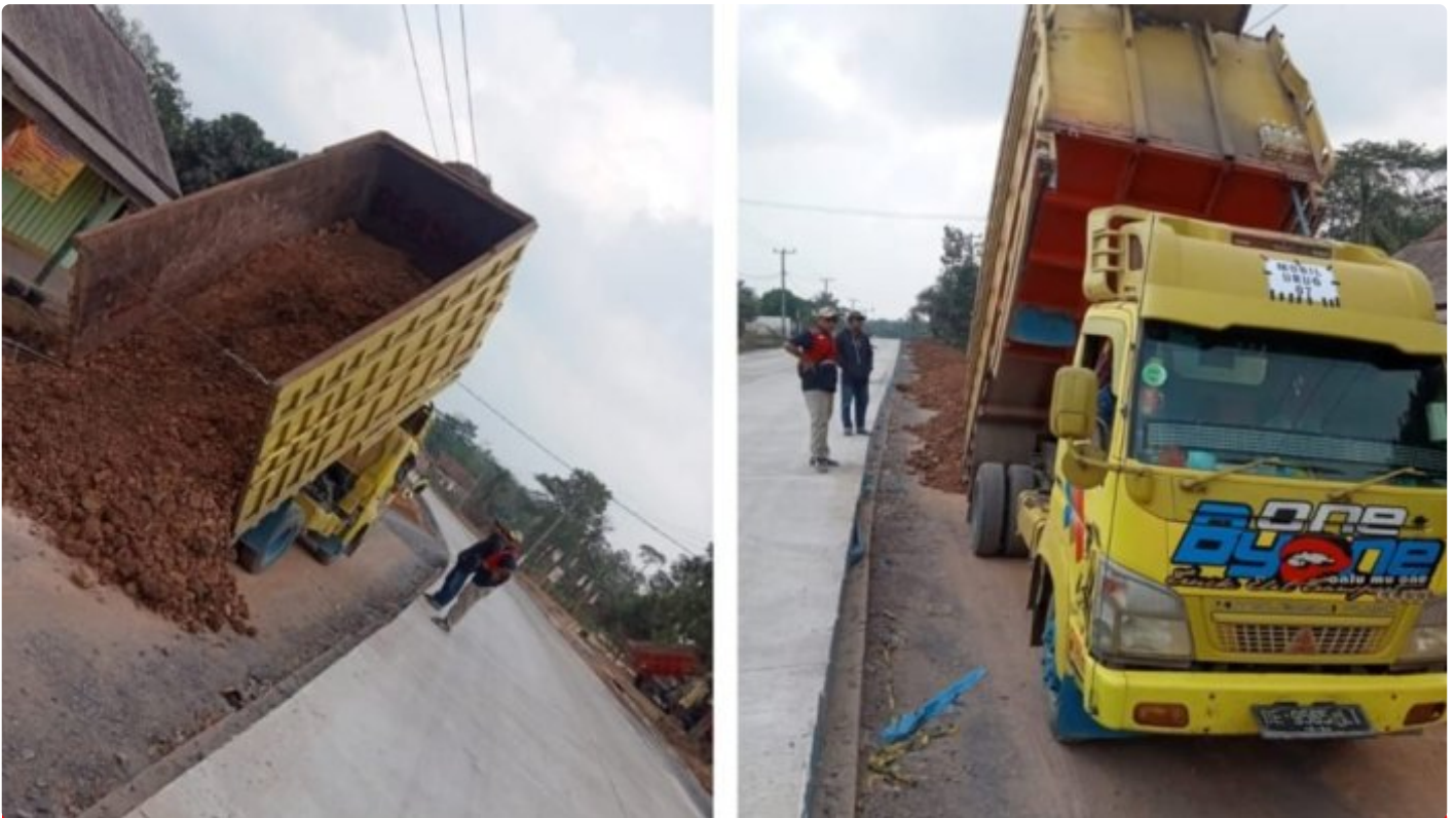
Mobil Pengangkut Tanah Galian C